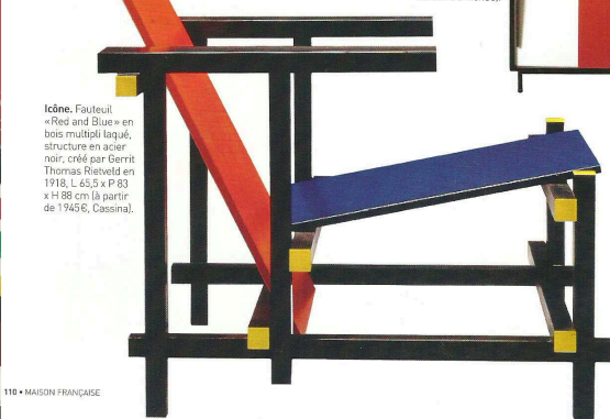
Icone. Fauteuil «Red and Blue» en bois multipli laqué, structure en acier noir, créé par Gerrit Thomas Rietveld en 1918, L 65,5 x P 83 x H 88 cm (à partir de 1945 €, Cassina).