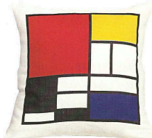
Douillet. Coussin «Square» en lin naturel, 47 x 47 cm (64 €, Rouge du Rhin).