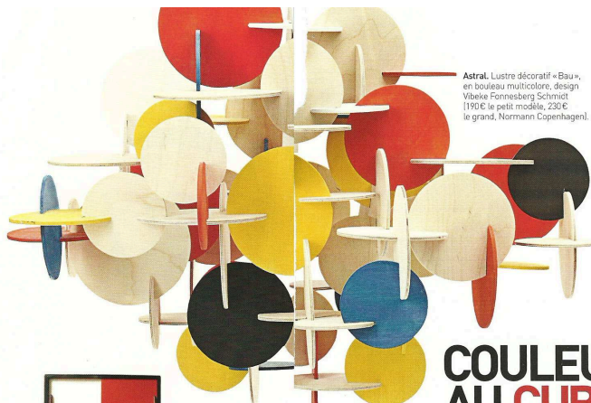
Astral. Lustre décoratif «Bau», en boueau multicolore, design Vibeke Fønnesberg Schmitz (1900 € le petit modèle, 2300 € le grand, Normann Copenhagen).