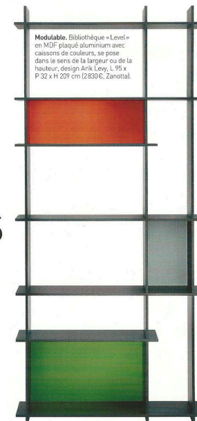
Modulable. Bibliothèque «Level» en MDF plaqué aluminium avec caissons de couleurs, se pose dans le sens de la largeur ou de la hauteur, design Anik Levy, L 95 x P 32 x H 209 cm (2630 €, Zanotta).