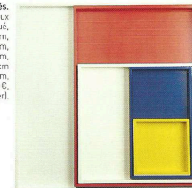
Imbriqués. Set de 5 plateaux en bois laqué, 17,5 x 17,5 cm, 35 x 20 cm, 37,5 x 37,5 cm, 40 x 37,5 cm et 60 x 60 cm, H. 3 cm (1150 €, Forestier).