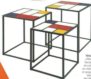
Gigognes. Selloettes «Rubix» en verre et métal, 59 x 59 cm, 66 x 66 cm et 73 x 73 cm (116 €, le set de 3, Amadeus).