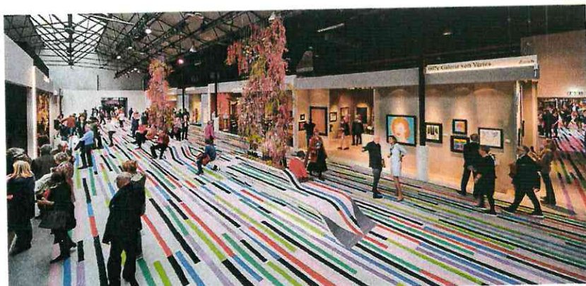
Atmosphère à la Brafa